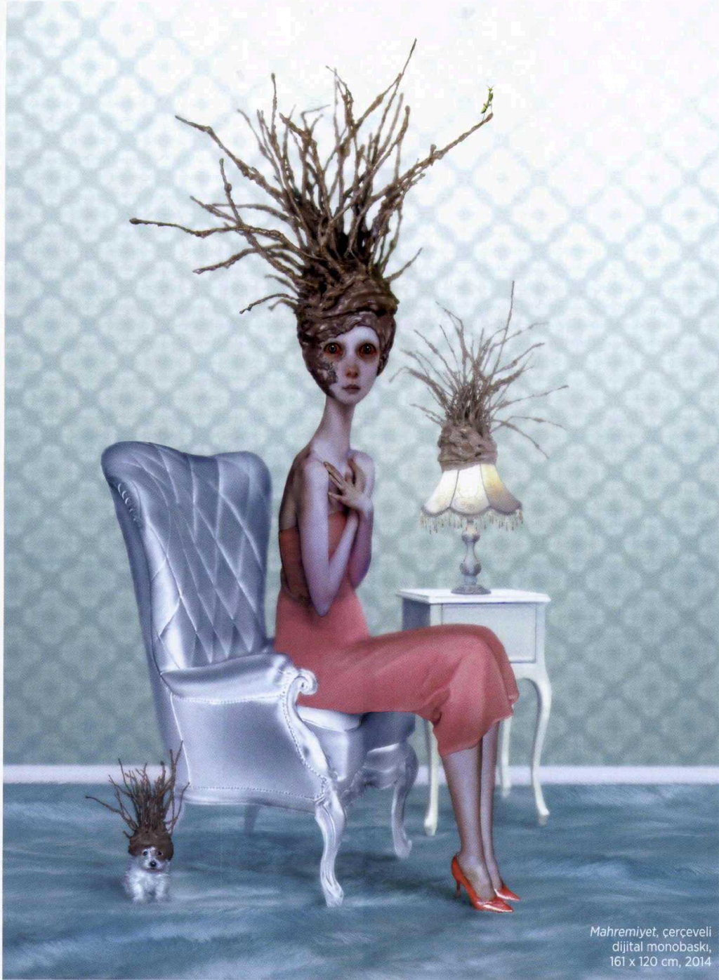
Mahremiyet, çerçevesiz dijital monobaskı, 161 x 120 cm, 2014